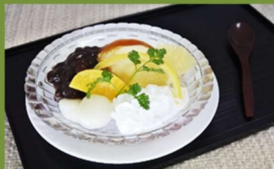
クリームあんみつ